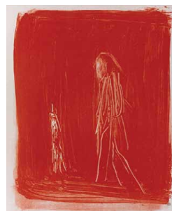
Henri Michaux, Meidosems , Paris, Éditions du Point du Jour, 1948. BnF, Rés. m. Ye. 1126