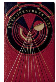
Henri Seguin, Un Train entre en gare , Paris, Éd. du Siècle, 1924. BnF, Rés. p. Y2. 3241