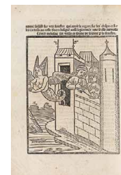
Jean d'Arras, Histoire de Mélusine , Lyon, 1479 BnF, Rés. fol. NFR. 129