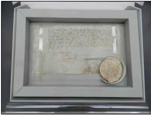
fig. 5. Mandement de Louis XI (1468). BnF, département des Manuscrits, fonds Colbert 17 Boîte réalisée par l'atelier de conditionnement du service Préservation.