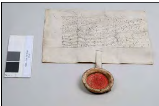
fig. 3. Sceau de Christian, roi du Danemark (1514). BnF, département des Manuscrit, fonds Colbert 747 Photo avant restauration : le sceau a été moulé au XIXe s. Des résidus de plâtre gênent la lecture des reliefs de cire