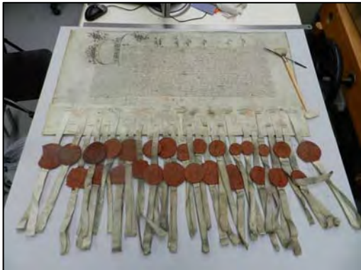
fig. 1. Ratification du mariage entre de Mary Tudor, fille d'Henry VII et de Charles d'Espagne, futur Charles Quint (1508), Bnf, département des Manuscrits, fonds Colbert 557

restaurés et reconditionnés. La réflexion conjointe de toutes les équipes mises à contribution devra permettre de trouver des solutions pérennes, tant en restauration-conservation de ces collections que dans leur mise en valeur.